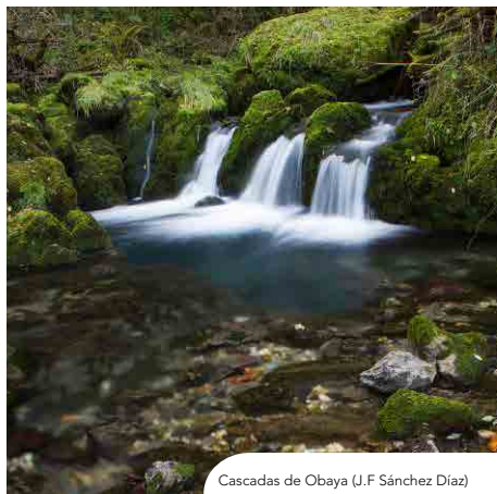
Cascadas de Obaya (J.F Sánchez Díaz)