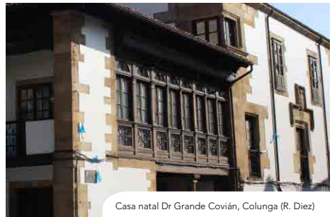
Casa natal Dr Grande Covián, Colunga (R. Diez)

Dejando la iglesia a la derecha, ascenderemos hasta la carretera AS-258. Seguiremos por ella a la derecha, unos pocos metros hasta la curva, para tomar, de nuevo a la derecha, el ancho camino de El Castru, que cruza de nuevo el río. Tomaremos al poco el camino de la derecha y en el siguiente cruce el de la izquierda, hasta llegar a las casas de Friera , a las que ya venimos dando vista. Cruzando bajo la autopista, llegaremos a Colunga, dejando la plaza del mercado de ganados a nuestra derecha y finalizando nuestra ruta en la plaza de la Iglesia.